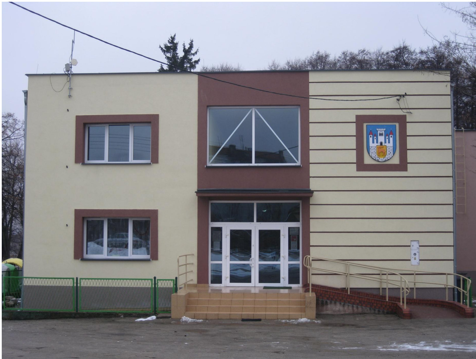
Biblioteka w Przemkowie