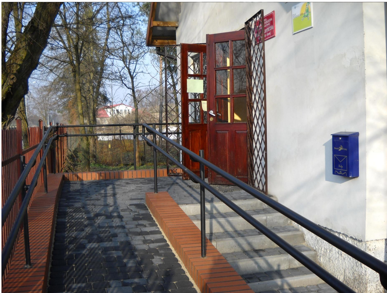
Biblioteka w Krężnicy