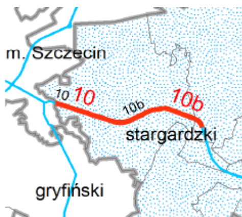
Rysunek 1. Lokalizacja analizowanych odcinków DK10 w gminie Kobylanka.

Wg raportów, WIOŚ w latach 2013 i 2012 na obszarze gminy Kobylanka nie prowadził pomiarów natężenia hałasu. Również aktualna „Mapa akustyczna dla dróg wojewódzkich o ruchu powyżej 3.000.000 pojazdów rocznie położonych na terenie Województwa Zachodniopomorskiego” nie zawiera analiz odnoszących się do terenów w gminie Kobylanka. Pomiary hałasu drogowego, na dwóch odcinkach DK10 przebiegającej przez gminę, prowadzono przed zmianą dopuszczalnych poziomów hałasu, w ramach opracowania map akustycznych dla dróg krajowych i ruchu powyżej 3 000 000 pojazdów przez GDDKiA.