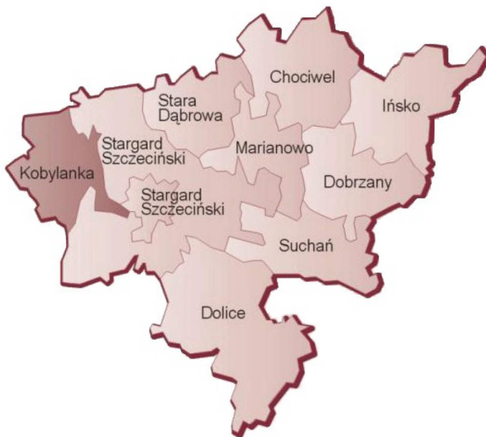
Rysunek 1: Położenie gminy Kobylanka na terenie Powiatu Stargardzkiego

Gmina Kobylanka położona jest w województwie zachodniopomorskim, w zachodniej części powiatu stargardzkiego (Rys. 1). Od północy sąsiaduje z gminą Goleniów (powiat goleniowski) od wschodu i południowego wschodu z gminą Stargard Szczeciński, od południowego zachodu z gminą Stare Czarnowo (powiat gryfiński), a od zachodu z miastem Szczecin (powiat grodzki).